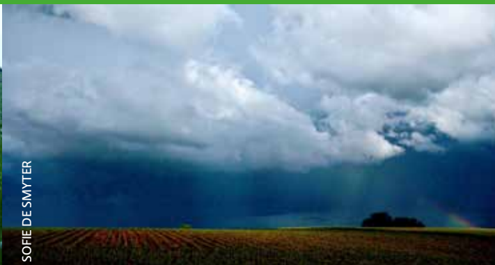
SOFIE DE SMYTER