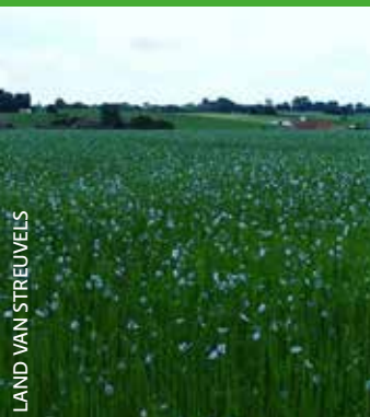
LAND VAN STREUVELS