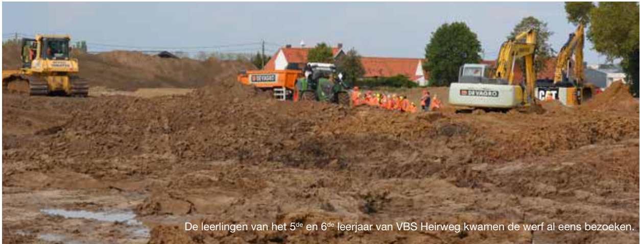
De leerlingen van het 5 de en 6 de leerjaar van VBS Heirweg kwamen de werf al eens bezoeken.