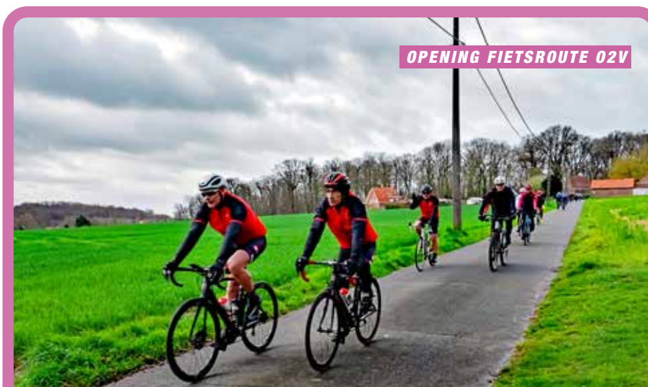
OPENING FIETSRUTE 02V

De 'Orde van de Piro' trok naar het rusthuis in Anzegem. Ze gaven uitleg over het ontstaan van de pirobakken en gaven een muzikaal optreden. Afsluiten deden ze, uiteraard, met een piro!