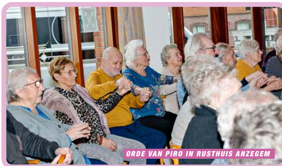
ORDE VAN PIRO IN RUSTHUIS ANZEGEM

Tijdens de week van de smaak organiseerden we een proevtjestocht waaraan verschillende verenigingen en vriendengroepen deelnamen. De vrienden van 'Partners in Taste' konden de jury overtuigen met hun hapje en wonnen een workshop in brouwerij Gruut. Proficiat!