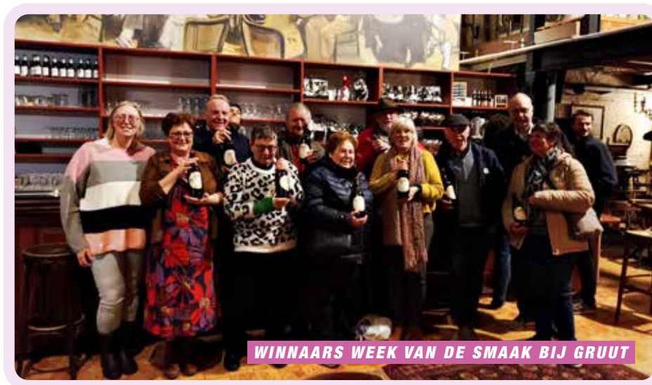
WINNAARS WEEK VAN DE SMAAK BIJ GRUUT

Tijdens de week van de smaak organiseerden we een proevtjestocht waaraan verschillende verenigingen en vriendengroepen deelnamen. De vrienden van 'Partners in Taste' konden de jury overtuigen met hun hapje en wonnen een workshop in brouwerij Gruut. Proficiat!