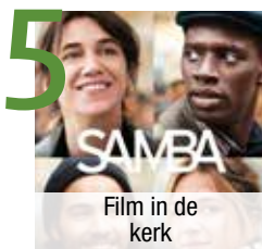
5 Film in de kerk