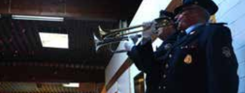
Ook dit was 2015: doe-dagen in Tiegembos, uitreiking van de Anzegemse Doend'rik, een grootschalige rampenoefening en ode aan de ode (30.000 ste Last Post).

velen, want we zorgden opnieuw voor een ruime waaier aan activiteiten voor jong en oud. Een van onze vrije tijdsdiensten veranderde ook nog eens van naam: zeg nu niet meer 'de Jeugdijndienst', maar wel 'DoeKéZot'!