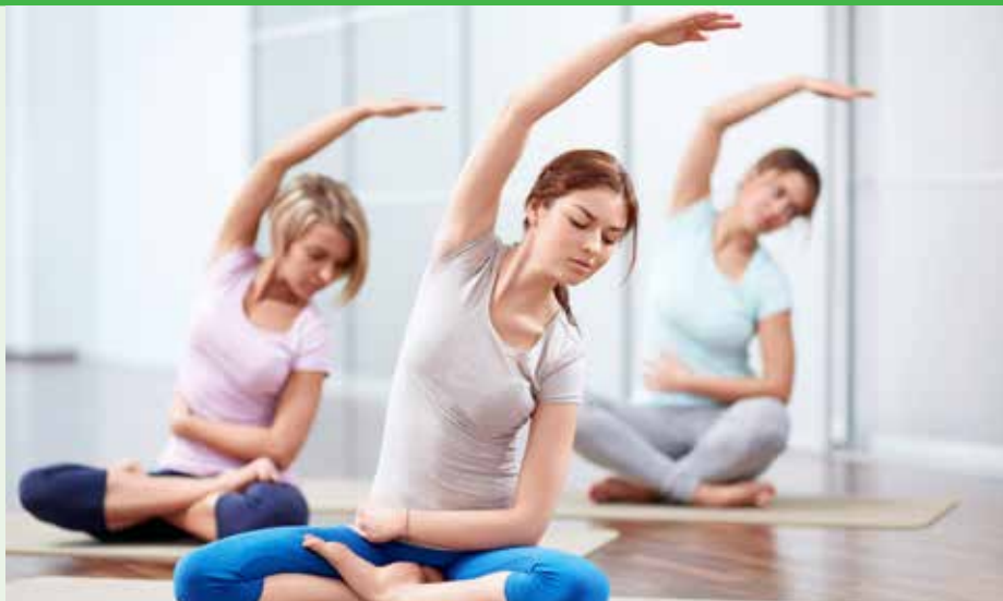
Met yoga halen we de positieve energie naar boven.

Voor kleuters en lagere schoolkinderen start de sportacademie vanaf woensdagnamiddag 6 januari opnieuw. In de Multi Move voor kleuters maken we telkens een bewegings-