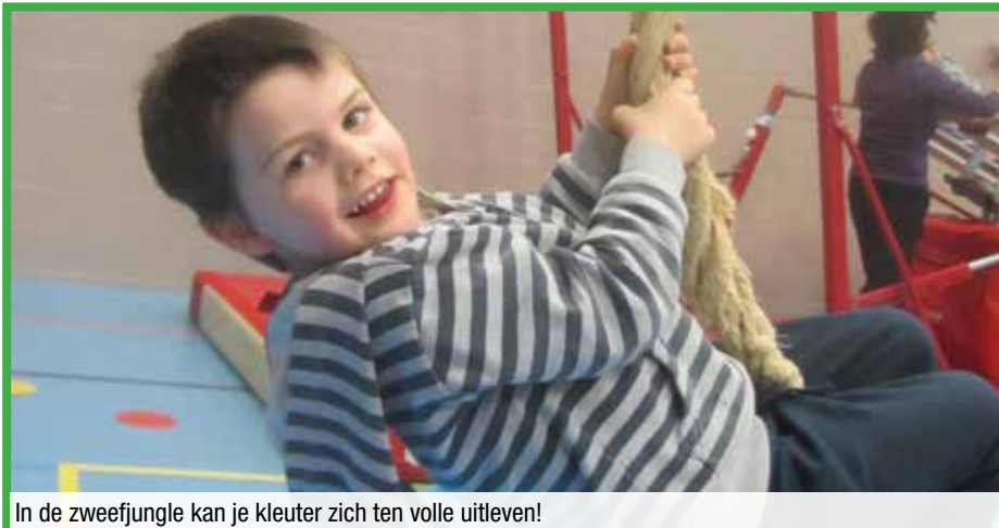
In de zweefjungle kan je kleuter zich ten volle uitleven!