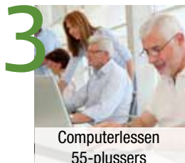
3 Computerlessen 55-plussers