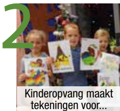
2 Kinderopvang maakt tekeningen voor...