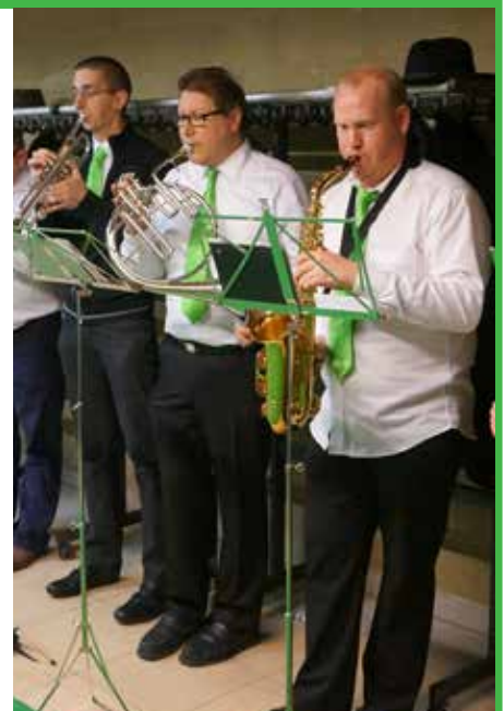
Vorig jaar zorgde de fanfare van Anzegem voor de sfeer.

In Vichte zal er ook een klein pendelbusje rijden tussen De Stringe, Vichteplaats (aan de Verteller) en de nieuwe kerk.