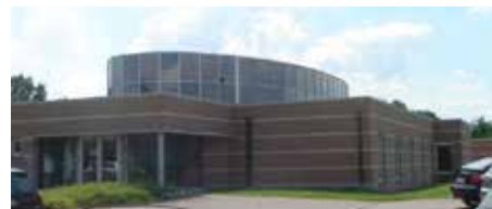
Het Sociaal Huis vind je in het OCMW-gebouw.

Meer info over het Sociaal Huis vind je in de januari-editie van Aktiv.