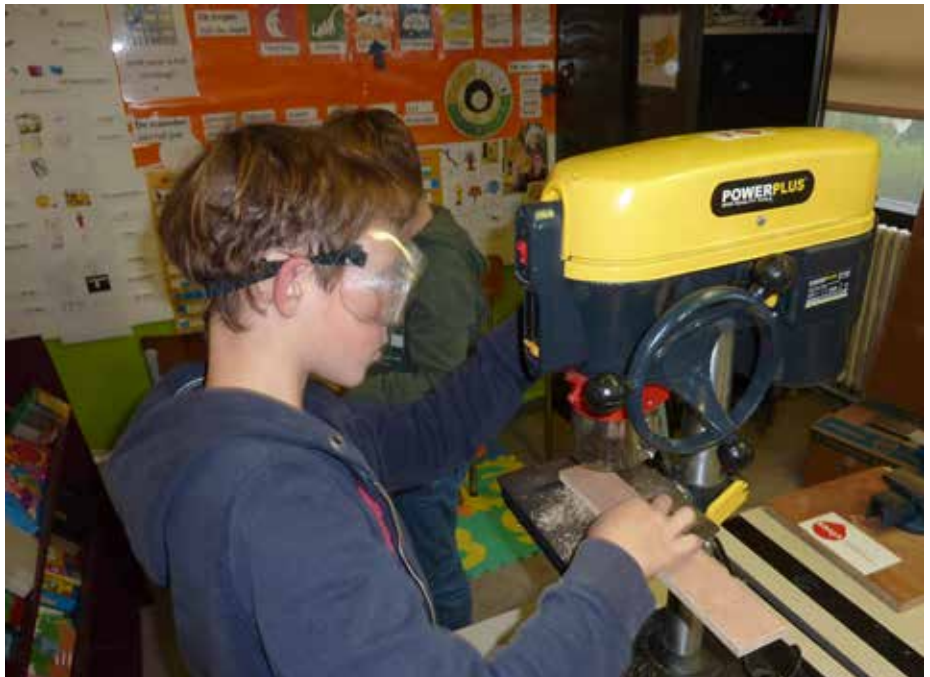
Leerlingen van het vijfde of zesde leerjaar die graag creatief bezig zijn, kunnen zich inschrijven voor de Techniekacademie.

De eerste workshop start al in de tweede week van januari en de plaatsen hiervoor