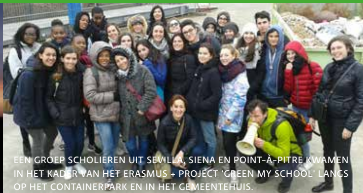
EEN GROEP SCHOLIEREN UIT SEVILLA, SIENA EN POINT-À-PITRE KWAMEN IN HET KADER VAN HET ERASMUS + PROJECT 'GREEN MY SCHOOL' LANGS OP HET CONTAINERPARK EN IN HET GEMEENTEHUIS.