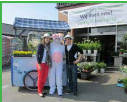
Zij deden alvast mee aan de editie van 2012.