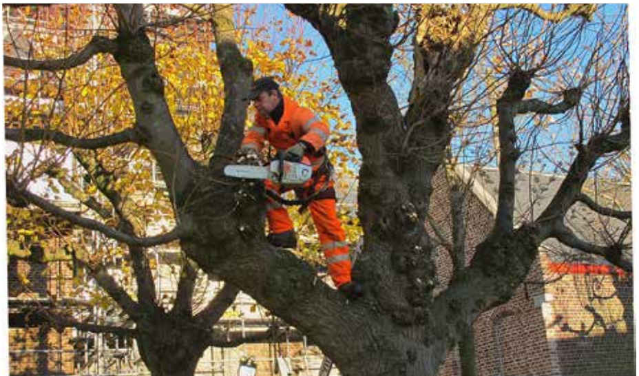
Onder andere bij de Technische Dienst zijn ze nog op zoek naar twee nieuwe collega's.

Je bent verantwoordelijk voor o.a. het plastificeren van boeken, het correct (terug)plaatsen