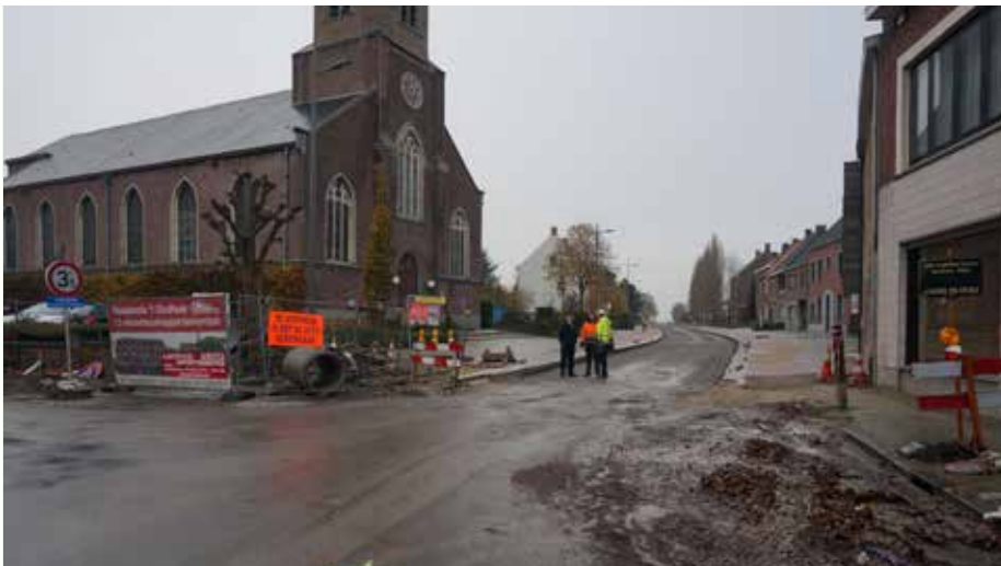
De eerste deelfase op de N36 werd - na het nemen van deze foto - ondertussen afgewerkt.