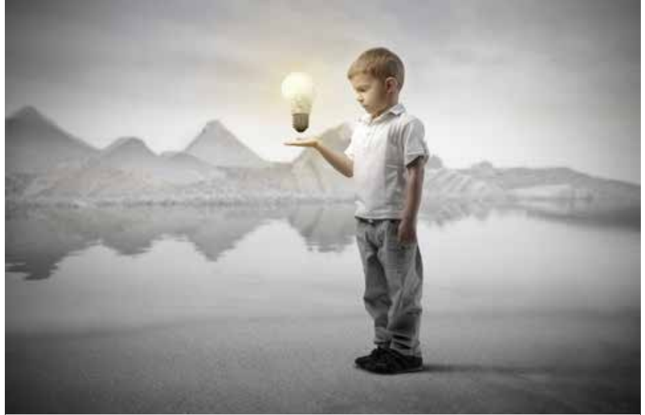
Door spaarzaam met elektriciteit om te springen, kunnen we een afschakeling vermijden.

Toch willen we ervoor zorgen dat het zover niet zal komen en hiervoor rekenen we ook op jullie. Als we allemaal een inspanning doen om ons stroomverbruik te beperken,