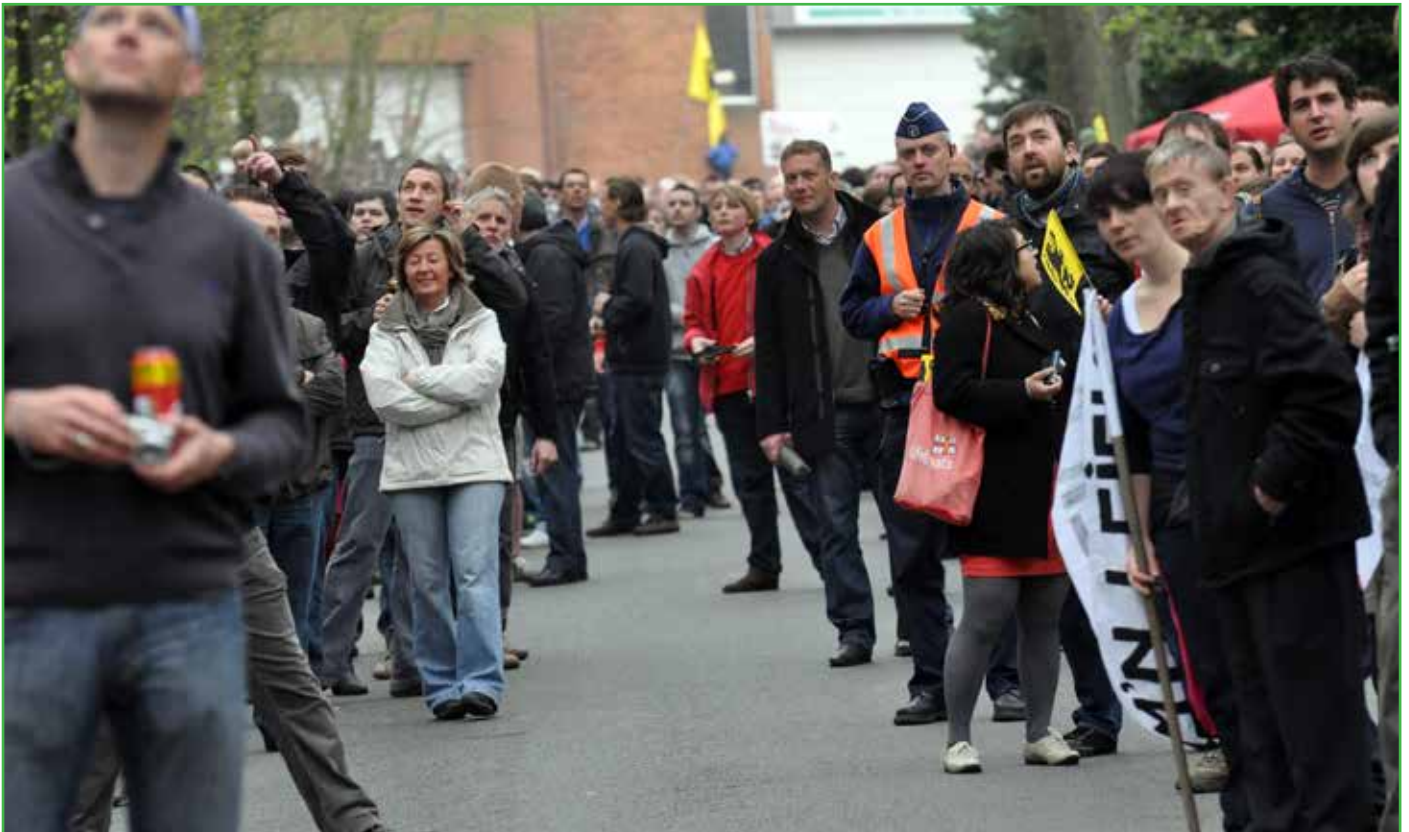
Het wordt opnieuw reikhalzend uitkijken naar de doortocht van de Ronde op Tiegemberg.