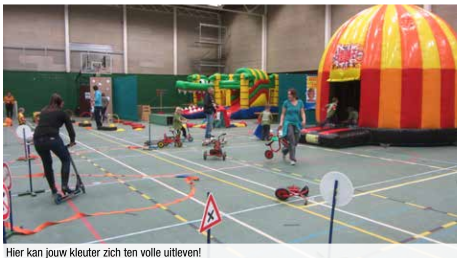
Hier kan jouw kleuter zich ten volle uitleven!

Deelname is gratis en voor iedere sportieveling is er een gratis drankje! Inschrijven kan via de flyer die verdeeld wordt in de scholen of op www.anzegem.be/kleuterhappening .