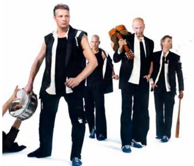
The Real Deal brengt een knettergekke show en bizarre acts.