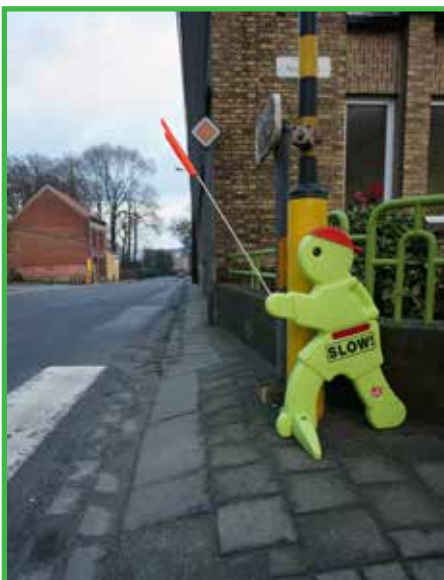
Aan de school zal het voetpad een stuk breder gemaakt worden.