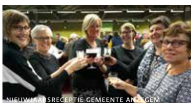
NIEUWJAARSRECEPTIE GEMEENTE ANZEGEM