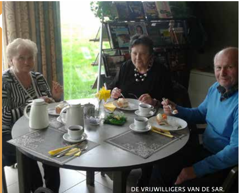
DE VRIJWILLIGERS VAN DE SAR.

Voor de bewoners van de plaatselijke woon- en zorgcentra organiseren we in het voorjaar een koffienamiddag.