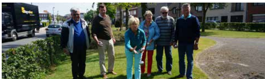
Wie heeft er zin om met deze groep mee te spelen?

julesvanhouteghem@live.be | 056 68 18 28 philippe1.veys@gmail.com | 0496 51 09 14