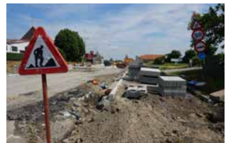
Nog eventjes op de tanden bijten...

De werken aan de N36 tussen Tiegem en Ingooigem zijn ondertussen wel al achter de rug. Daar deed AWW structurele onderhoudswerken omdat het wegdek in slechte staat was en dringend aan herstelling toe was. Onder andere het voetpad aan de school werd een stuk breder gemaakt, zodat de kinderen op een veilige manier naar school kunnen stappen.