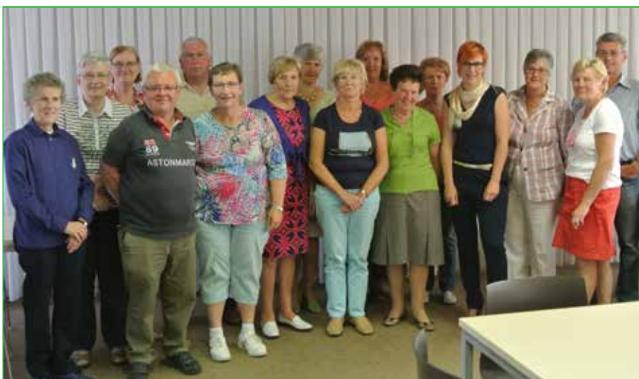
De eerste Anzegemse cursisten van Open School.