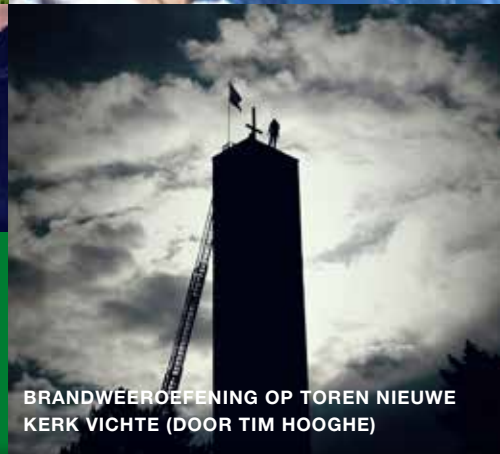
BRANDWEEEROEFENING OP TOREN NIEUWE KERK VICHTE

Vrije tijd in Anzegem? Voor elk wat wils!