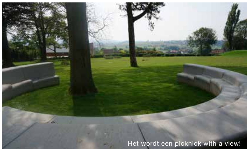
Het wordt een picknick with a view!

Alle animaties zijn gratis. Drankjes en ijsjes kan je aan democratische prijzen krijgen Iedereen van harte welkom!