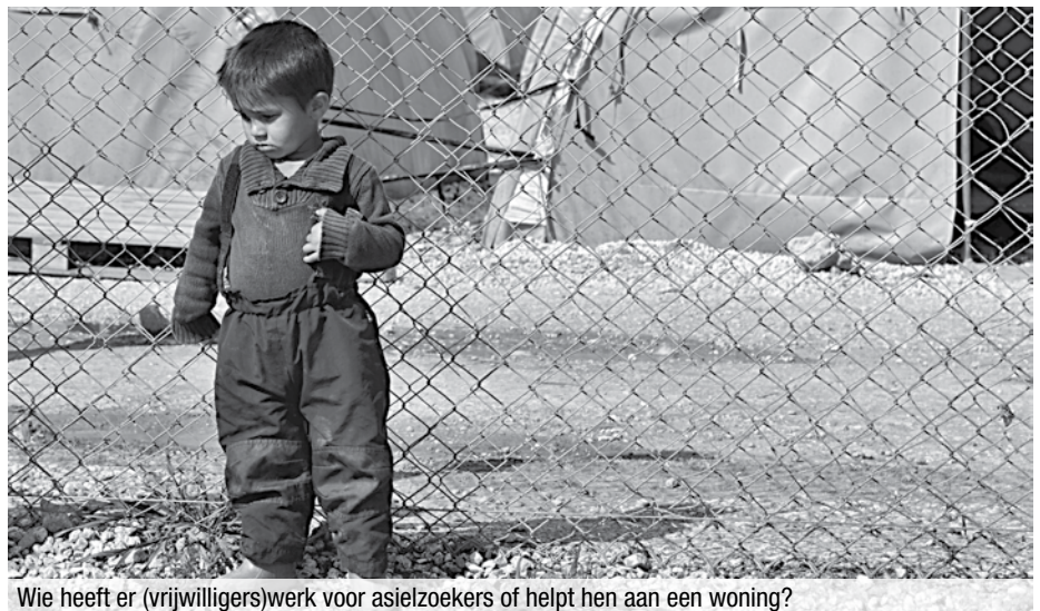
Wie heeft er (vrijwilligers)werk voor asielzoekers of helpt hen aan een woning?

2. Als de asielzoeker toestemming krijgt om in België te blijven, moet er op een korte tijd naar een woning gezocht worden. Dit is vaak