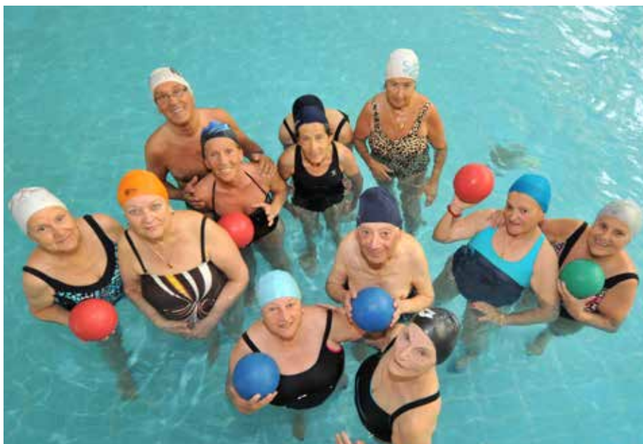
Wie duikt er mee het water in?