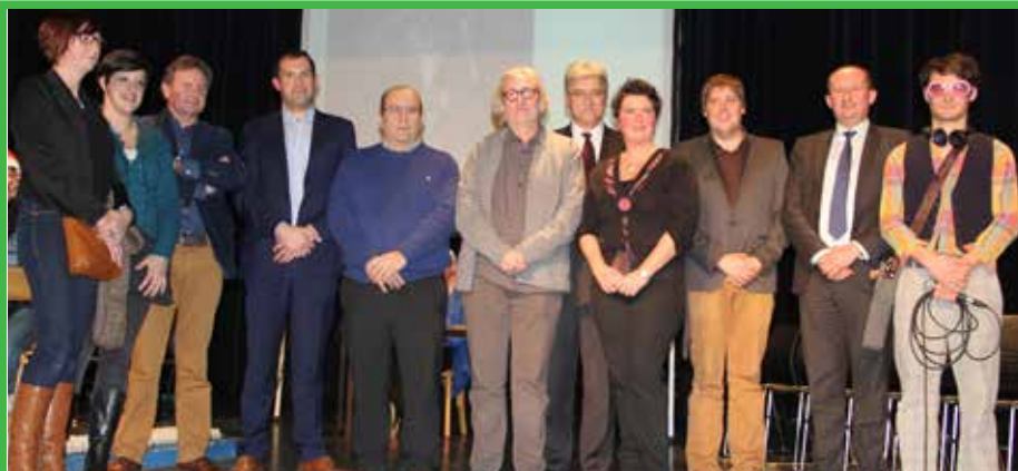
Vorig jaar mocht de Koninklijk Fanfare St.-Cecilia de cultuurtrofee in ontvangst nemen.