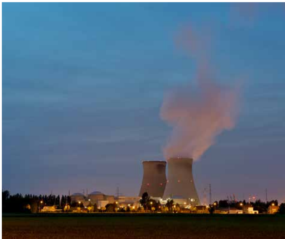
Zullen de reactoren deze winter genoeg elektriciteit kunnen produceren?

Stel dat er een stroomtekort dreigt, dan zullen we dit 7 dagen op voorhand weten. De bedoeling is dat we die periode gebruiken om zelf op ons elektriciteitsverbruik te letten,