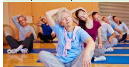
Verbeter op een leuke en ontspannende manier jouw kracht en lenigheid.