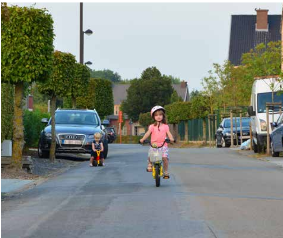
In een fietsstraat mogen auto's fietsers niet inhalen en kunnen de fietsers dus gebruik maken van de volledige breedte van hun straatheft.

In de zijstraten van de Nieuwpoortstraat (= Nieuwpoortterf, Limburg Stirumdreief en Sint-Elooistraat) zullen we ook zone 30 en de