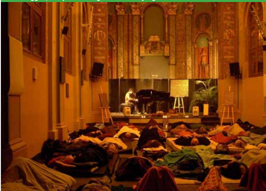
Met gesloten ogen en liggend genieten van een concert. Een unieke ervaring.

Lekker liggen, ontspannen en genieten: voor jong en oud