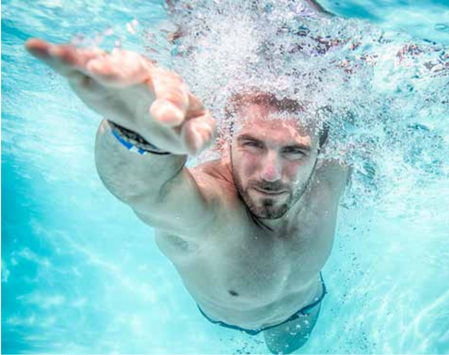
Het zwembad komt er, maar de exacte locatie hangt af van het advies van Ruimte Vlaanderen.