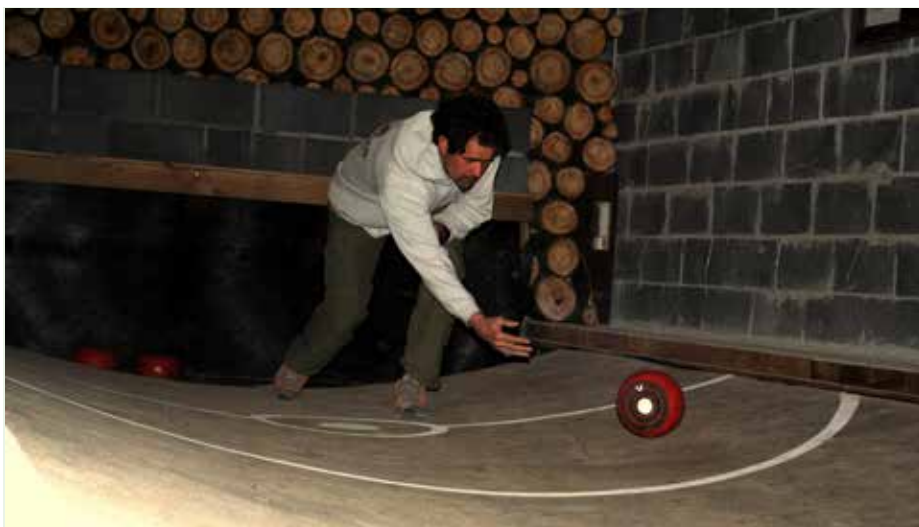
Bolletra: een moeilijkere versie van petanque.