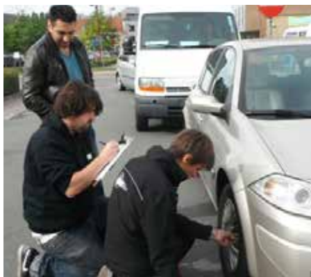
Bespaar één tankbeurt en laat je bandenspanning controleren.