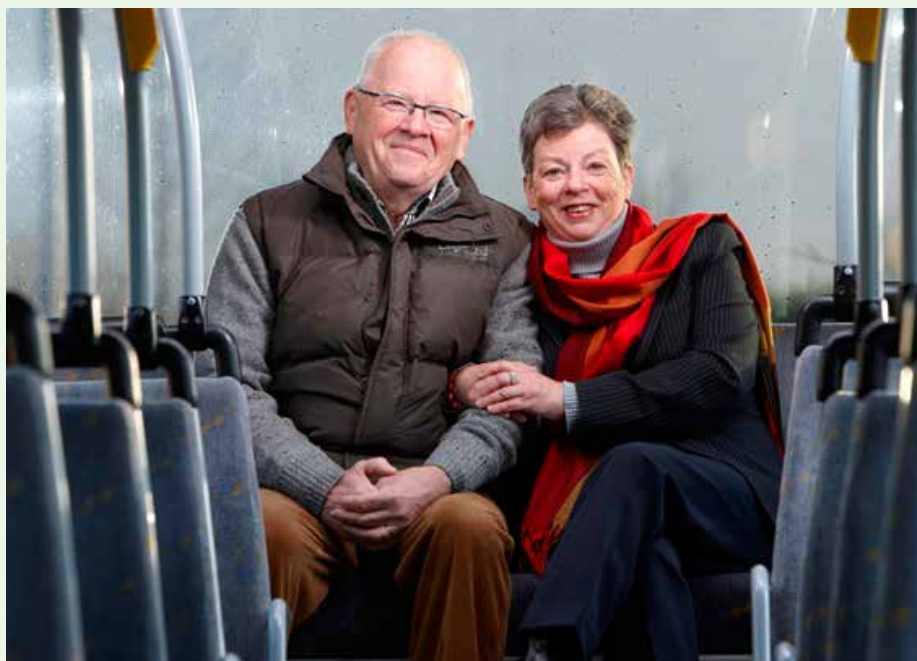
Vanaf 1 september vervallen de meeste gratis abonnementen voor 65-plussers.

Reis je momenteel met een MOBIB-kaart met een gratis abonnement voor 65-plussers en heb je recht op een gratis abonnement? Gooi deze kaart dan zeker niet weg. Deze kaart is 5 jaar geldig en je hebt ze in de toekomst nodig als 'moederkaart' bij de omschakeling van het gratis papieren abonnement voor personen met een handicap naar een elektronische versie.