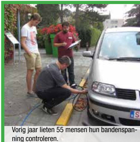
Vorig jaar lieten 55 mensen hun bandenspanning controleren.