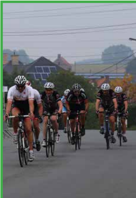
Er vindt ook dit jaar een parochianenkoers in Anzegem plaats.

Je betaalt het verschuldigde bedrag via overschrijving op reknr. BE74 73802533 4907 (cultuurdienst Anzegem) of cash en dit ten laatste op de vormingsavond zelf.