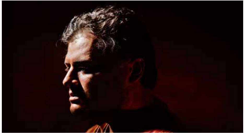
In de bioscoop zal je een operavoorstelling van Otello kunnen volgen.

Op zaterdag 17 oktober spreken we samen af om 18u30 aan Kinopolis Kortrijk voor een avondje 'opera in de cinema'. We worden er ontvangen met een glaasje cava en krijgen er nog een korte inleiding door een deskundige ter plaatse. Vanaf 19u volgen we live de voorstelling vanuit de Metropolitan Opera in New