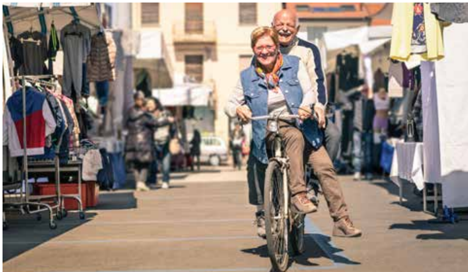
Bij het graveren brengt men jouw rijksregisternummer op het frame van je fiets aan.

Deze vindt plaats op woensdag 9 september van 14u-18u in de loods van de gemeentelijke Technische Dienst, Sint-Arnolduslaan, Tiegem.